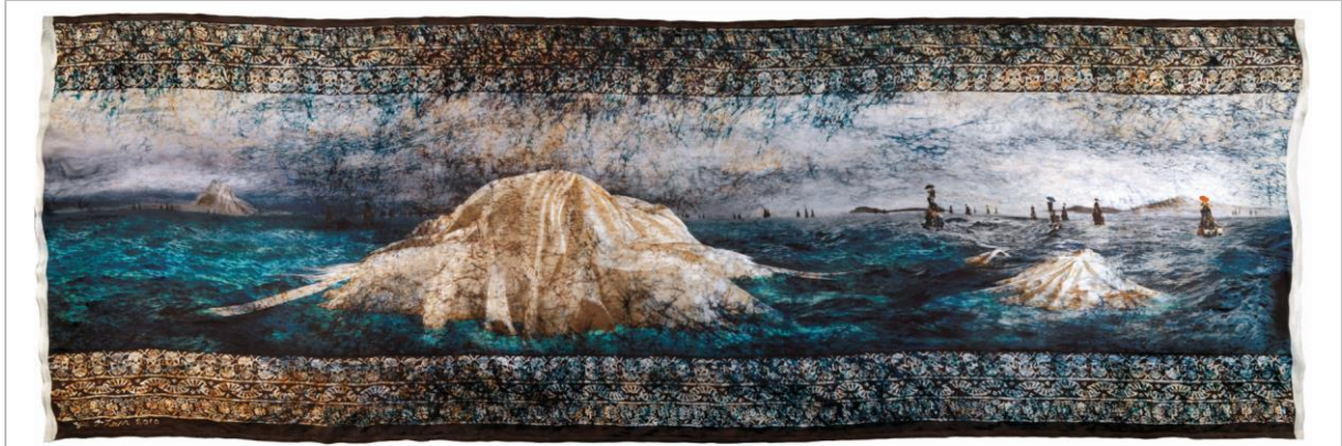
于一蘭 · 《大人物系列：海盜帝國與其輝煌事業》 · 2010