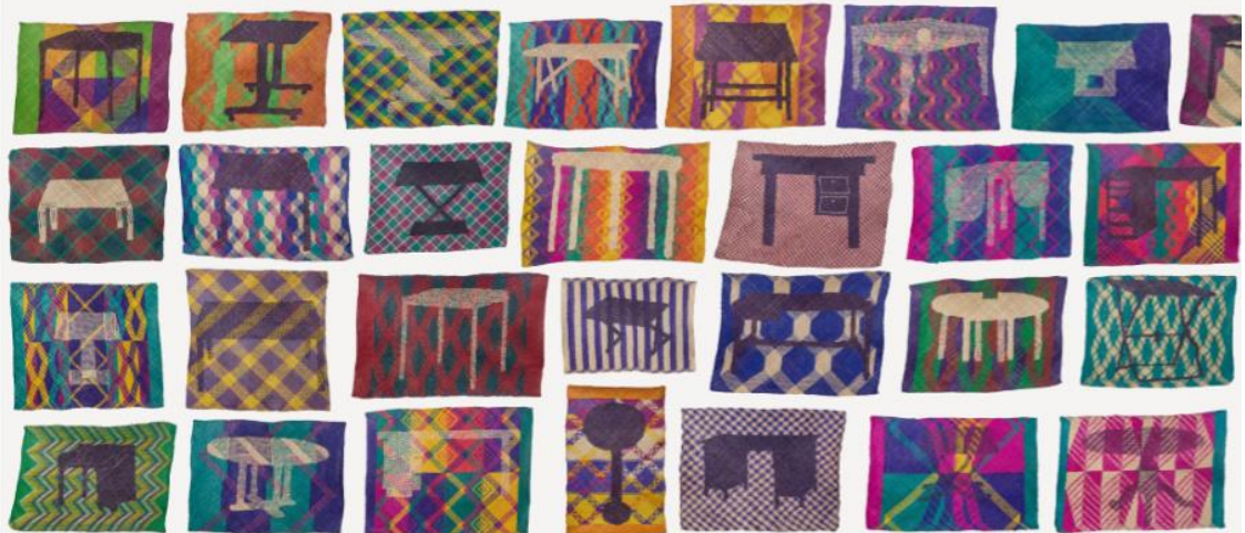
于一蘭與編織夥伴 Sanah、Kinnohung、Budi、Kuoh、Turuh、Lokkop、Barahim、Tularan、Darwisa、Alisya、Daiyan、Dayang、Tasya、Dela、Enidah、Norsaida、Bobog、RoZIAh、Latip · 《織墊/桌子》 (版本 2/2) · 2020 (局部)