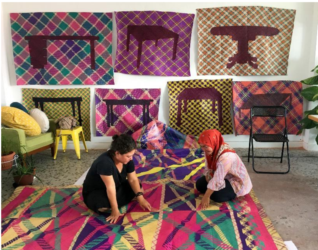
于一蘭及來自奧瑪多島的合作夥伴 Roziah

( 香港 · 2021 年 7 月 28 日 ) CHAT 六廠 ( 六廠紡織文化藝術館 ) 將於 2021 年 9 月 1 日至 11 月 7 日，舉行來自馬來西亞沙巴、國際上享負盛名的當代藝術家于一蘭在香港首個個人展覽——「于一蘭：直到我們再度相擁」。展覽通過新的委約作品和現有作品、開放式舞台表演體驗以及眾多的互動和共學項目，展現馬來西亞沙巴人民的抗逆精神。展覽呈現及對照香港和馬來西亞在殖民時期的本地文化和生活方式。